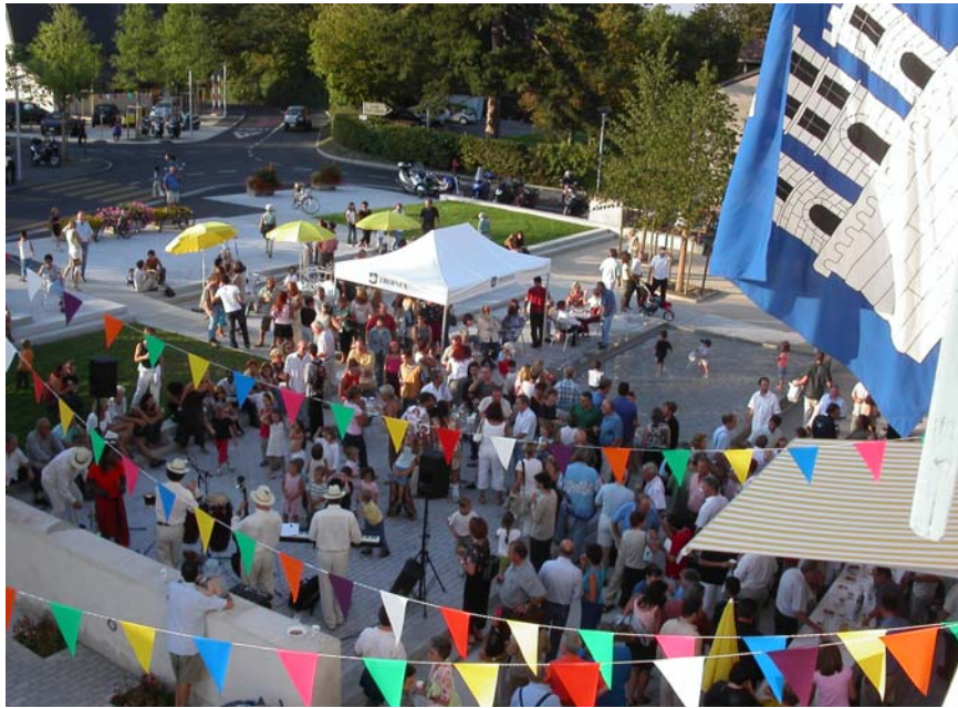
Inauguration de la place et de la nouvelle mairie

Voici quelques souvenirs en image de l'été 2004 à Troinex