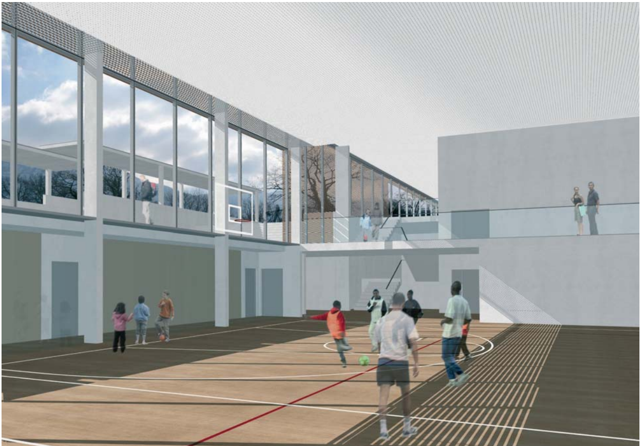
Vue de la future salle de sport